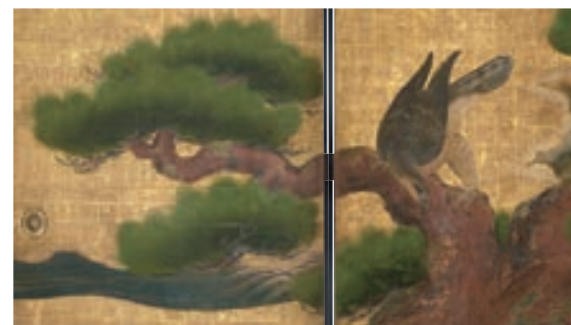
国指定重要文化財 二条城二の丸御殿 大広間 狩野山楽筆 四の間の障壁画 松鷹図(部分) 寛永3年(1626) 京都市(元離宮二条城事務所)蔵

城において政治・儀礼・生活の舞台となった「御殿」。その内部は豪華絢爛な障壁画、金工品などで彩られ、権威を演出していました。本展では、名古屋城本丸御殿や二条城二の丸御殿など江戸時代初期に遡る貴重な遺例とともに、石川県のシンボル・金沢城二の丸御殿をめぐる最新の研究成果を紹介し、城郭御殿の室内装飾がもつ機能と美のあり方に迫ります。