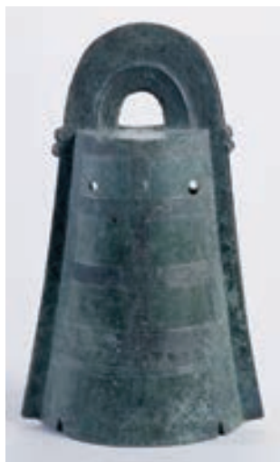
国宝 島根県加茂岩倉遺跡出土銅鐺 弥生時代中期 国(文化庁保管)

石川県は古代から大陸の文化が流入する海の玄関口になってきました。日本海の交易ルートは弥生時代から発達し、奈良～平安時代には日本海の対岸にあった渤海の使節が加賀・能登を往来しました。本展では、日本海沿岸の各地や朝鮮半島・中国大陸との交流を物語る資料を展示し、加賀・能登に繁栄をもたらした日本海交易の源流をたどります。