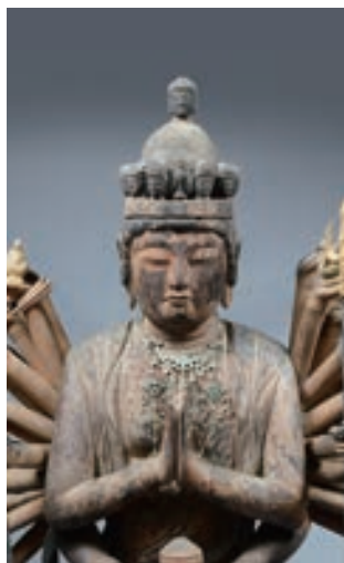
石川県指定文化財 木造千手観音立像(部分) 平安時代中期 10～11世紀 穴水町 明泉寺蔵

霊場とは多くの信者の参詣を許す開かれた聖地のことです。平安時代後期に全国的な霊場が成立すると、続けて各地で小規模な霊場である在地霊場が誕生します。そこでは多くの参詣者を迎え、活発な宗教活動が行われていました。本展では石川県内における霊場の発生と展開を紹介し、参詣した人々の「祈り」を見つめます。