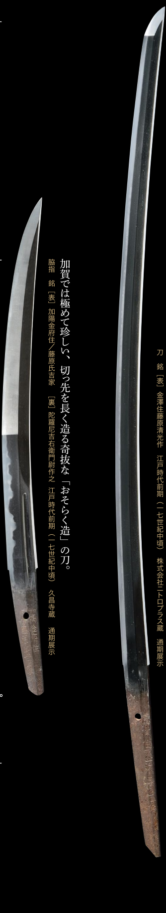
加賀では極めて珍しい、切っ先を長く造る奇抜な「おそらく造」の刀。 脇指 銘「丞 加陽金府住 藤原氏吉家」(裏 陀羅尼吉石衛門尉作之 江戸時代前期(一七世紀中頃) 久昌寺蔵 通期展示)