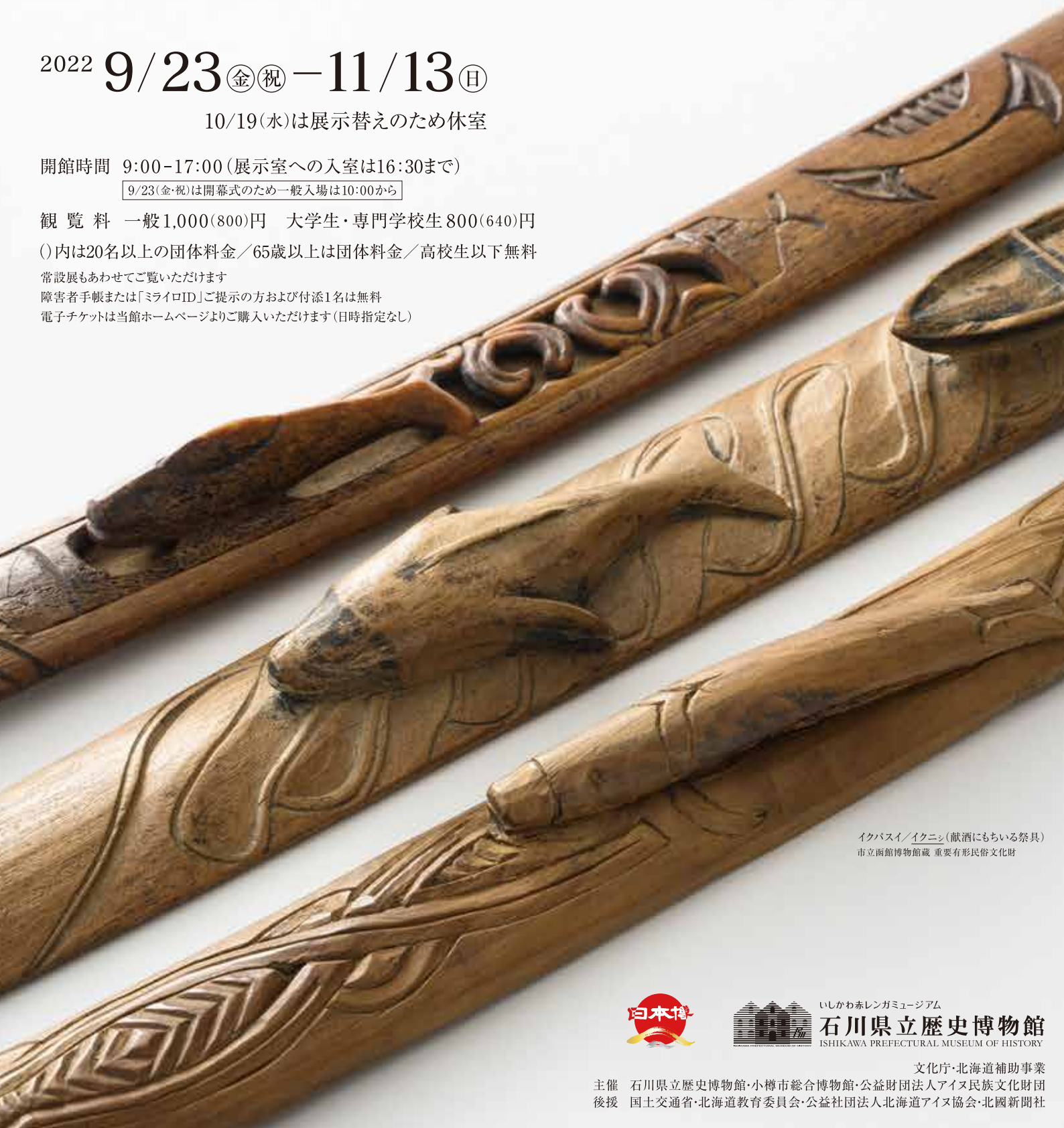
イクパスイ/イクニシ(献酒にもちいる祭具) 市立函館博物館蔵 重要有形民俗文化財