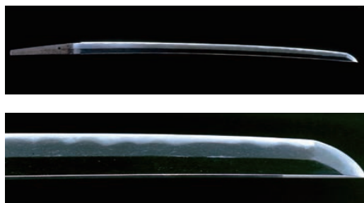
刀 初代兼若 江戸時代 本館蔵

加賀の地で作刀された加州刀を、古刀から新刀・新々刀まで、系譜別・年代別に俯瞰し、魅力を探ります。なかでも「兼若」や「清光」の代々は圧巻です。併せて拵 こしらえ の逸品も公開します。