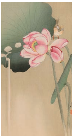
小原古邨「蓮に雀」 木版多色摺 明治時代後期 中外産業株式会社蔵(原安三郎コレクション)

金沢生まれの絵師・小原古邨(1877～1945)。木版画を多く手掛け、花や鳥の織り成す詩情あふれる作品は、制作当時から現代に至るまで、欧米で根強い人気を誇っています。近年、国内でも再評価の気運が高まりつつある中、故郷での初の回顧展にあたる本展では、作品の魅力を余すことなく紹介するとともに、未だ知られざる創作の舞台裏に迫ります。