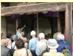
過去の歴史散歩の様子

※れきはくメイト会員は随時募集しています。詳しくは当館普及課までお問合せください。