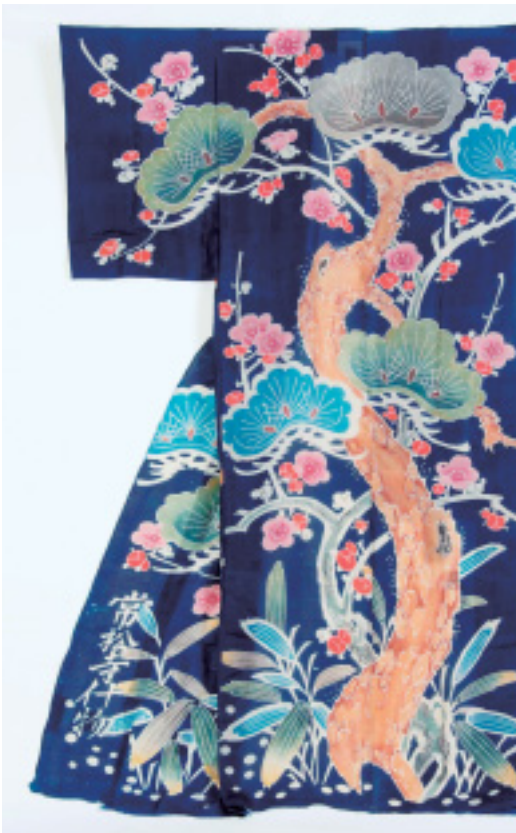
松竹梅文様 よぎ 夜着 江戸時代後期 加賀お国染・ 花岡コレクション