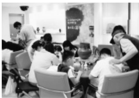
子どもたちでにぎわうタッチミュージアム （韓国国立全州博物館）

展示会にあわせて行う子ども向けのワークショップ活動についても教育学芸員と協議を繰り返してきまし