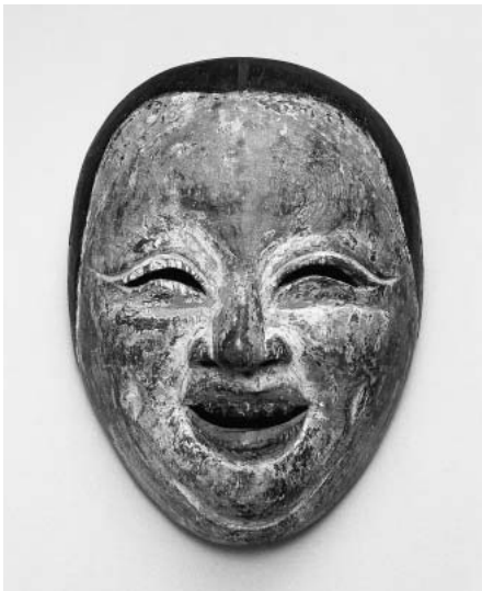
重要文化財 女面 長滝白山神社蔵