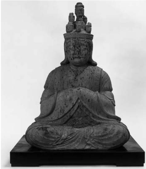
福井県指定文化財 十一面女神坐像 八坂神社蔵