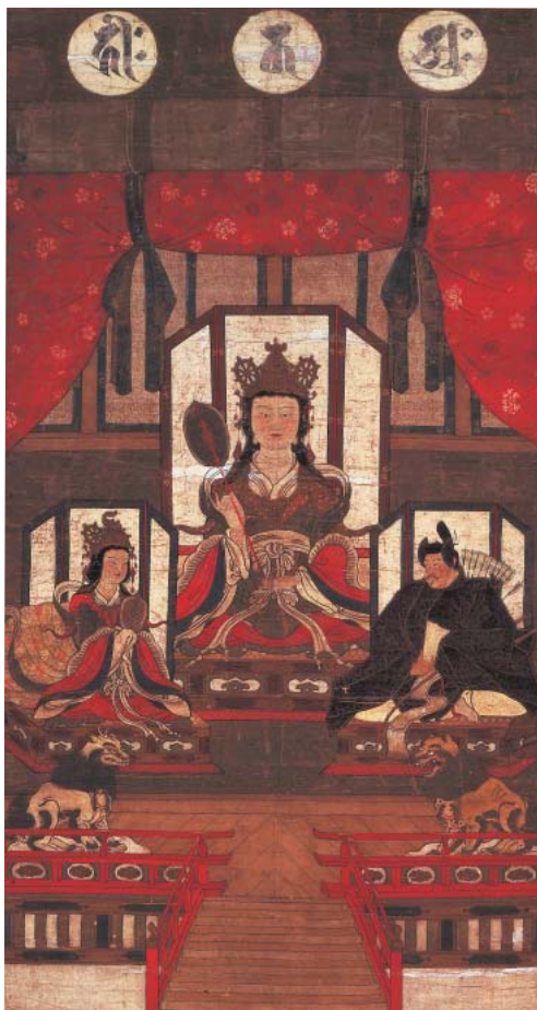
重要文化財 白山三社神像 白山比咩神社蔵

会 期 7月21日(土)~8月26日(日) 会 場 第1・2特別展示室 共 催 北國新聞社 開館時間 午前9時~午後5時 (入館は午後4時30分まで)会期中無休 入 館 料 一 般 700円(560円) 大学生 550円(440円) 高校生以下無料 ( )内は20名以上の団体料金