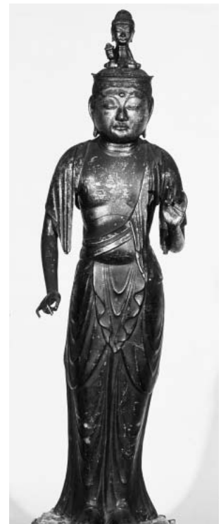
重要文化財 十一面観音立像 林西寺蔵