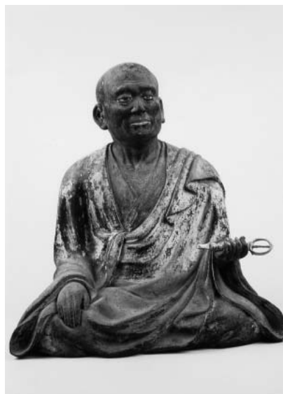
重要文化財 泰澄大師及二行者像 泰澄大師坐像 大谷寺蔵(展示品は複製)