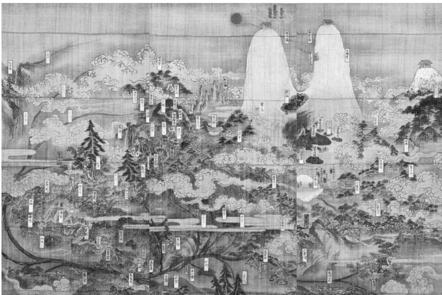
石川県指定文化財 白山曼荼羅 能美市蔵