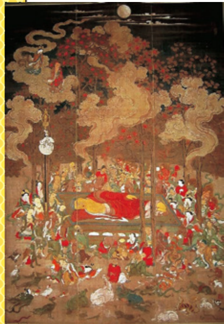
▲無分筆 仏涅槃図 長壽寺 全体

仏涅槃図は、釈迦が、末羅国(古代インドの十六大国の国の一つ)の拘尸那揭羅(インド北東部、ネパールの国境近くの古代都市の遺跡)の近く、跋提河の岸边にある沙羅双樹の中で身を横たえ、最後の説法をした後、80年の生涯を閉じ入滅したという情景を表したもので、顔を北に顔を西に向けて宝台上に横たわる姿を描いています。