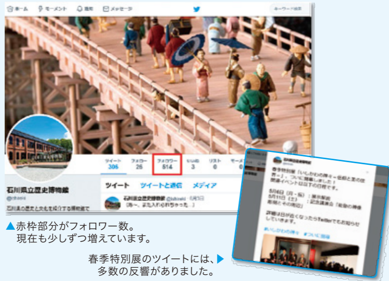
▲赤枠部分がフォロワー数。現在も少しずつ増えています。 春季特別展のツイートには、多数の反響がありました。

2018年3月に開設した当館Twitterのフォロワーが500人を超えました。次は1000人を目標に、Twitterならではの情報を引き続き発信していきます。