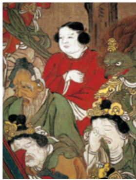
▲無分筆 仏涅槃図 長壽寺 角髪(美豆良)の童子

福井県小浜市にある真言宗の谷田寺本の鎌倉時代に描かれた福井県指定文化財の「仏涅槃図」と比較しますと、会衆たちの像容や配置など類似性が看取でき、長壽寺本と深い関わりがあることが考えられます。しかし、一方で画面の比率や天空の満月の大きさ、左右の細い雲の有無、下部の動物や昆虫の配置に少しの違いがあるなど相違点もあり、今後、無分の素性の解明と合わせ研究の必要があります。