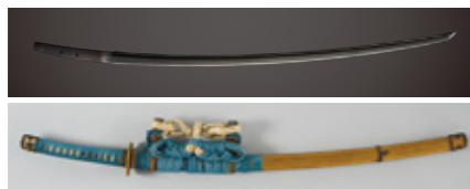
太刀 銘 恒次 附金梨地糸巻太刀拵 北野天満宮蔵 重要文化財

本展は、加賀前田家の天神信仰がいかにして形成され、菅原道真を祀る京都の北野天満宮と前田家がどのような関わりを持っていたのか、という問題に迫る初めての試みです。