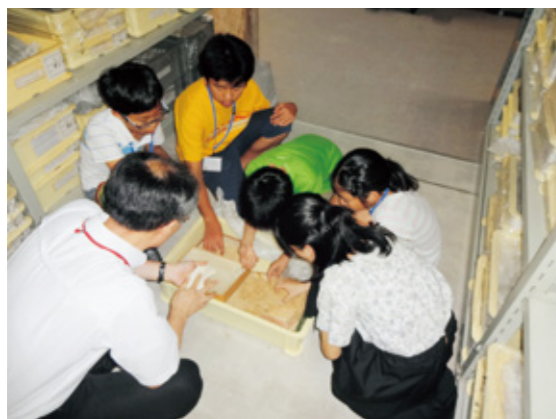
▲学芸員による児童生徒への学習支援

では、博物館のどのような点がアクティブ・ラーニングに適しているのでしょうか。博物館は、教室を離れ、限られた時間内で多種多様な情報源から、主体的に課題解決のための資料を選定して、自力解決を図ることができる教育施設です。学芸員と博物館資料という人的・物的資源が子どもたちの学習活動をサポートします。全員に共通する学習課題を示し、博物館という限られた空間の中で展示資料を介して調査活動を行う学習は、まさに子どものアクティブラーニングの学習力を訓練する場として最適です。また、博物館での学びは、子どもが生涯にわたる学習力を身に付けるうえでも大切な学びの機会になるはずだと。最後に、今後は、単なる見学の間としてだけでなく、アクティブ・ラーニングの学びと場として博物館を再活用していただければ幸いです。