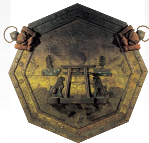
■ 前田家寄進の巨大な懸仏 正覚院蔵

ここでは、かつて気多神社の講堂に祀られていた阿弥陀如来坐像(重要文化財 羽咋市 正覚院蔵)のほか、県内の代表的な懸仏を紹介しします。懸仏とは、神鏡に顕れた仏菩薩を表現したもので、もとは「御正体」と呼ばれました。懸仏は銅製が多いのですが、本県では古くから木製や鉄製の遺品がみられるのが特徴です。また、気多神社本殿にあった前田家寄進の日輪懸仏は、幅157cmを測る全国最大級のもので、そのスケール感を間近にご覧いただけます。