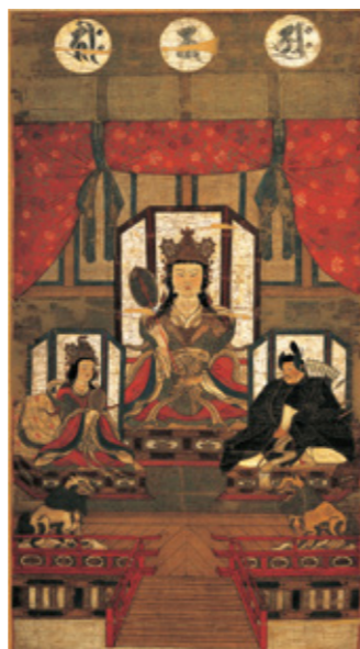
■ 白山に坐す気高き女神像 白山比咩神社蔵

ここでは、門外不出とされてきた久麻加夫都阿良加志比古神坐像(重要文化財 七尾市 久麻加夫都阿良加志比古神社蔵)が千年の時を超えて初公開されるほか、県内の代表的な神像が展覧されます。また、絵巻では白山三社神像(重要文化財 白山市 白山比咩神社蔵)を4月27日から5月17日の期間限定で公開しますので、神秘性をたたえた神の姿をご堪能ください。