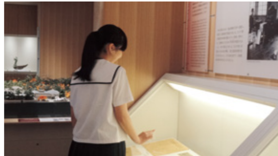
▲展示資料を活用した探求学習

アクティブラーニングという言葉をご存知でしょうか。児童・生徒が授業を受けるのではなく、授業に主体的に参加する学習方法のことです。具体的には教師による一方的な指導ではなく、児童・生徒による体験学習や教室でのグループ・ディスカッション、ディベート、グループ・ワークを中心とする授業のことを指します。学校現場ではよく聞かれる言葉ですが、それ以外の方にとってはあまり馴染みのない言葉かもしれません。一見博物館とは縁がない言葉のように思えますが、近年、子どもたちに「主体的・対話的な深い学び」のスキルを身に付けさせるため、いくつかの博物館でアクティブ・ラーニング(主体的・対話的で深い学び)の手法を導入しているところがあります。そこで、今回はアクティブ・ラーニングの手法を取り入れた博物館学習の今後について述べたいと思います。