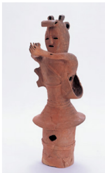
■ 神と人との仲立ちをする巫女像 小松市蔵

つぎに、人形などの形代 かたしろ を使って大規模な祓い儀礼 はらひ が行われた七尾市小島西遺跡や古代気多神社の祭場跡とみられている羽咋市寺家遺跡をとりあげ、律令国家の法のもとで行われた神まつり(神祇祭祀)の地方的展開を展望します。