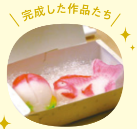
完成した作品たち!