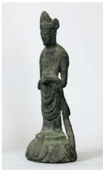
■ 飛鳥時代の銅造菩薩立像 西光寺蔵

このほか、海の彼方から寄りついた漂着神と薬師如来との習合や白山などの山岳神に接近しようとした山林修行者の台頭、さらには国司神拝の記録などをもとに、当地における神仏習合の萌芽と展開について取り上げます。