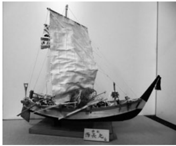
No.60 面長丸模型(昭和期)