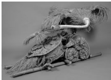
No.83 ツルカメ(昭和20年製作)