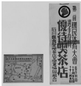
No.46 鞍コレクション 第2回国民体育大会関係資料(昭和22年)