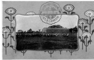
No.44 兵器庫(現・石川県立歴史博物館)の絵葉書(明治42年)