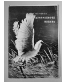
No.4 創立20周年記念 金沢市中央公民館合唱団第20回演奏会(朱鷺幻想)プログラム(昭和47年)