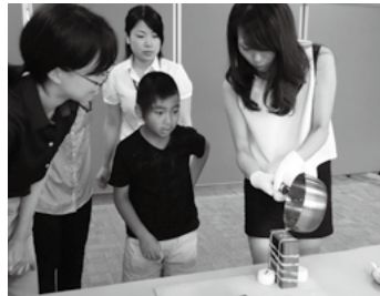
鋳型に金属を流し込んでいます