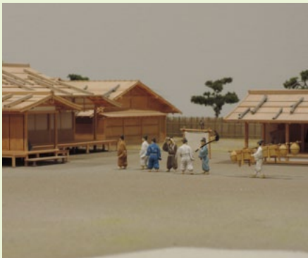
堅田館模型 (縮尺: 1/50) 監修: 小野正敏、富島義幸、向井裕知 建築復元図面製作: 竹川浩平

今回の展覧会では、堅田館跡から出土した 陶磁器や武器、呪いの札、建築部材など、約 八〇〇年前の武士の暮らしに関する資料を展 示します。また、復元の根拠となった資料や 模型の製作過程などもわかりやすく紹介しま す。ぜひご覧ください!