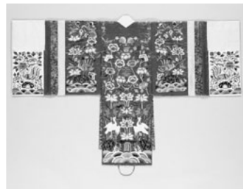
貴族女性の婚礼衣装 朝鮮時代後期 韓国国立中央博物館蔵

ここでは、朝鮮時代の特権階級の人々が生涯で経験する儀礼や、官職に関わる行事について紹介します。刺繍で飾られた婚礼衣装や装飾品の他、朝鮮時代後期を代表する絵師・金弘道が両班の記念日を描いた「平生図」にもご注目ください。