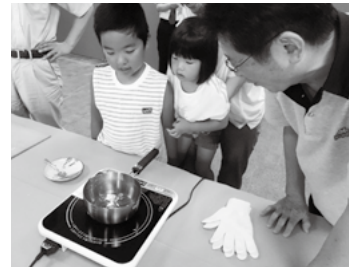
金属を溶かしています