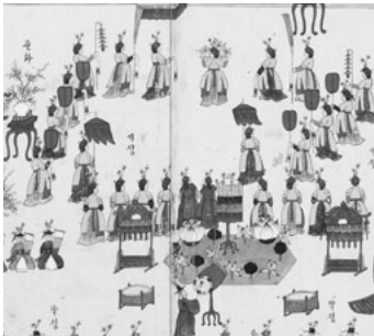
國幸整理儀軌圖 朝鮮時代(19世紀) 韓国国立中央博物館蔵

朝鮮時代の宮廷では、多様な宴が催されましたが、儀軌という記録や絵画、また美しく装飾された調度品から、その様子をうかがうことができます。今回、ドラマ「イ・サン」で知られる二十二代王・正祖の、華城への行幸と盛大な行幸を描いた一連の資料が公開されます。めくるめく宮廷宴会の様子をお楽しみください。