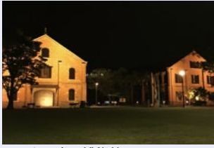
いつもの夜の博物館