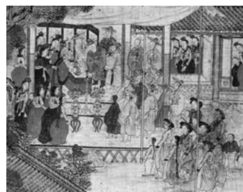
平生図 朝鮮時代後期 韓国国立中央博物館蔵