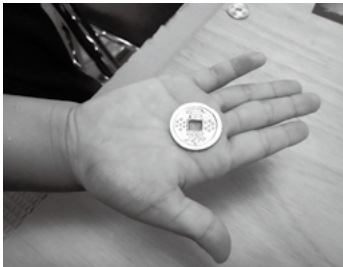
上手にできました！

当日は参加した子どもたちだけでなく、保護者の方も一緒になって楽しんでくださいました。子どもたちには合金が溶けるところが特に面白かったようで、どの子も食いつくように見つめていました。保護者の方には合金を鋳型に流し込む作業をしていただきましたが、熱々の合金が流れていく様を皆さん真剣に見守っていました。合金が固まるのを待っている間は、古代のお金について簡単なレクチャーをして、昔のお金はどのように使われていたのか、今のお金と何が違うのかを考えていただきました。最後は富本銭のバリを紙やすりで削る作業です。夢中になって削りすぎてしまう子もいたようですが、出来上がった富本銭をお土産に、皆さん笑顔で帰って行かれました。