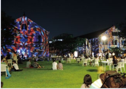
デジタル掛け軸の様子 (8月7日撮影)

兼六園周辺文化の森サマーミュージアム ウィーク(七月三十一日～八月九日)のイベ ントの一つとして、八月七日(金)・八日(土) の二日間、夜間延長開館(十七時～二十一時、 常設展のみ)とともに「夕暮れコンサート in 本多の森」、「onn 本多の森 D.K.Iレ ジタル掛け軸」を行いました。日没後、高さ 約八m、幅約九mの赤レンガ建物三棟の壁面 に画像が投影されると、博物館のある本多の 森公園が幻想的な空間に包まれ、歓声があが りました。一〇〇万種類の映像が三〇秒ごと にゆったりと移り変わり、二度と同じ映像を 見ることができない「二期一会」の光の演出。 二日間で約二二〇〇人の方にご来場いただ き、新しくなった博物館の展示もたくさん 方に見ていただきました。重厚な雰囲気の内 レンガ建物が、まさかこんな姿になるとは……! なんだかとても新鮮でした。