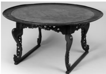
朱漆虎足盤 朝鮮時代後期 韓国国立中央博物館蔵