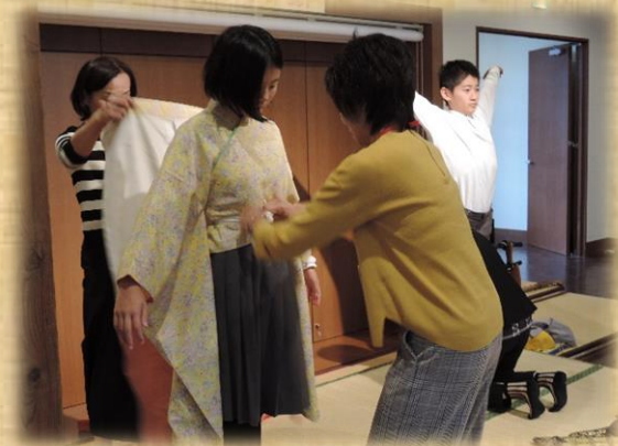
歴史衣裳の着付けの補助