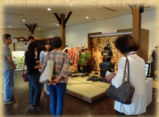
ボランティア研修